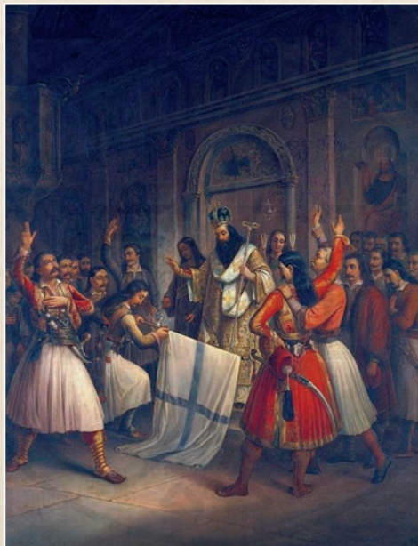
Ὁ Παλαιὸν Πατρῶν Γερμανός εὐλογεῖ τὴ Σημαία τῆς Ἐπανάστασεως

ἐπίσημος ἡμέρα ἀπαρχῆς τῆς Ἑλληνικῆς Ἐπανάστασεως τοῦ 1821 καὶ καθιερώθη ὡς ἐθνικὴ ἑορτὴ γιὰ τὴν συμβολικὴ καὶ θρησκευτικὴ τῆς σημασία.