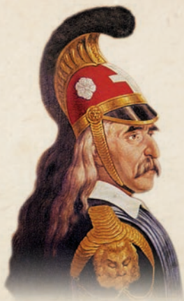
Ό Θεόδωρος Κολοκοτρώνης

μπετη Μαυρομιχάλη και από τον Άπριλιο του 1821 άρχισε ή πολιορκία τής πόλεως. Όμως ό Χουρσίτ Πασάς, πού ήταν Καϊμακάμης του Μορέως μέ έδρα τήν Τριπολιτσά, τώρα εύρισκετο μακρυνά και πολεμοϋσε τον Άλη Πασά των Ίωαννίνων, πληροφορηθείς τήν πολιορκία τής Τριπολιτσάς έστειλε 3.500 Άλβανούς μέ άρχηγό τον Μουσταφάμπετη διά τήν ενίσχυσι τής φρουράς τής πόλεως. Ό Μουσταφάμπετης σέ τολμηρή σύγκρουσί του μέ τον Κολοκοτρώνη στό Βαλτέτσι νικήθηκε στις 12 και 13 Μαΐου του 1821. Η νίκη στό Βαλτέτσι ήταν ή πρώτη νίκη των Έλλήνων οργανωμένων κατά των εμπείρων τουρκων πολεμιστών και έκρινε τήν τύχη τόσο τής Τριπολιτσάς, πού έπεσε στις 23 Σεπτεμβρίου στά χέρια των Έλλήνων όσο και ολοκλήρου του άγώνος. Γι αυτό ό Κολοκοτρώνης διακήρυξε: «Τουτες οι μέρες 12 και 13 του Μάη θά δοξάζονται ως ότου τό Γένος μας στέκει γιατί ήταν ή Έλευθερία τής Πατρίδος».