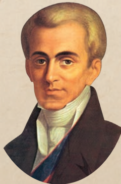
Ὁ Ἰωάννης Καποδίστριας

Ἔτσι ἐκλείσαν τά γεγονότα τοῦ πρώτου ἔτους τῆς Ἐπαναστάσεως τοῦ 1821, ἀλλά ὁ ἀγώνας συνεχίσθηκε καί παρά τίς διχοστασίες καί τίς διχόνοιες τῶν πολιτικῶν καί στρατιωτικῶν ἔφθασε μέχρι τοῦ ἔτους 1827, ὅτε ἔλαβε χώρα ἡ Ναυμαχία τοῦ Ναυαρίνου 8 Ὀκτωβρίου 1827 καί τήν 11ην Ἰανουαρίου 1828 κατῆλθε στήν Ἑλλάδα ὁ Ἰωάννης Καποδίστριας ὡς πρῶτος Κυβερνήτης αὐτῆς καί ἐπεδόθη εἰς τήν ἐκ τοῦ χάους ἀνασυγκρότησιν τῆς Χώρας μέ ἀναζωογόνησι τῶν πολεμικῶν ἐπιχειρήσεων καί κατάληξιν τήν ὑπογραφήν τοῦ πρώτου Πρωτοκόλλου τοῦ Λονδίνου στίς 10 Μαρτίου τοῦ 1829 διά τοῦ ὁποίου ἀνεγνωρίσθη Ἑλληνικόν Κράτος πού περιελάμβανε τήν Πελοπόννησο, τά νησιά τοῦ κεντρικοῦ Αἰγαίου καί τήν Στερεάν Ἑλλάδα μέχρι τοῦ Ἀμβρακικοῦ καί Παγασιτικοῦ κόλπων, μέ πολίτευμα Συνταγματικῆν Μοναρχίαν ὑπό Χριστιανόν Ἡγεμόνα.