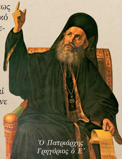
Ὁ Πατριάρχης Γρηγόριος ὁ Ε΄

Ἀπό τήν ἀρχή τῆς Ἐπαναστάσεως διεφάνη τό στρατιωτικό καί πολιτικό πνεῦμα τοῦ ἔμπειρου Ὁπλαρχηγοῦ Θεοδώρου Κολοκοτρώνη, ὁ ὁποῖος διέβλεψε τήν ἀνάγκη νά στραφῇ κατά τοῦ Κέντρου τῆς Πελοποννήσου καί νά ἐγκαταστήσει μόνιμο ἐπαναστατικό στρατόπεδο στήν Τριπολιτσά. Τό σχέδιο του νά περισφίξη τήν πόλι καί νά τήν ἀναγκάσει σέ παράδοσι ἔγινε δεκτό καί ἀπό τόν ἀνακηρυχθέντα Ἀρχιστράτηγον τοῦ ἀγῶνος Πετρό-